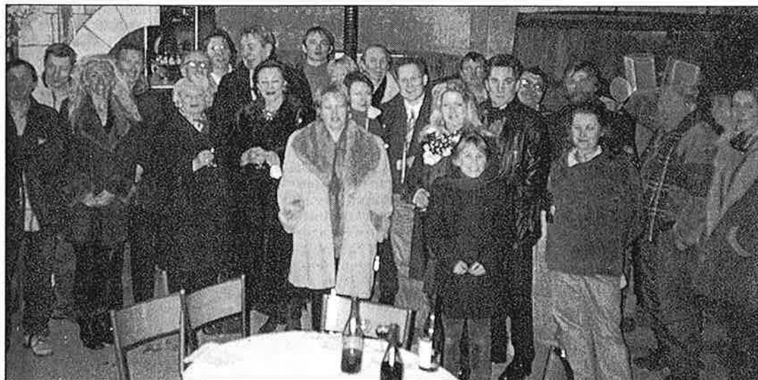
Une partie des membres fondateurs de l'Académie de la Bresse et leurs hôtes du Revermont Gourmand ici à Journans au soir de l'assemblée générale constitutive.